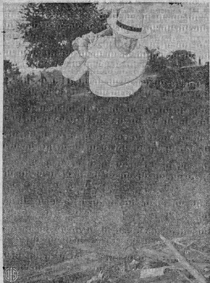
HACIENDO EJERCICIO — He aquí al candidato demócrata a la vice presidencia, Alben W. Barkley cuando hacía ejercicio en la hacienda de su hijo en Paducah, Estado de Kentucky.