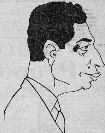
RECUERDOS DEL CONGRESO DE LAS UNIVERSIDADES

EL MISMO DIA Y A LA MISMA HORA CIRCULA "EL GRAN DIARIO LA NACIÓN" EN LAS CINCO REPUBLICAS DE CENTRO-AMERICA. TOME UD. NOTA DEL GRANDIOSO ESFUERZO TECNICO Y ECONOMICO QUE ESTO REPRESENTA.