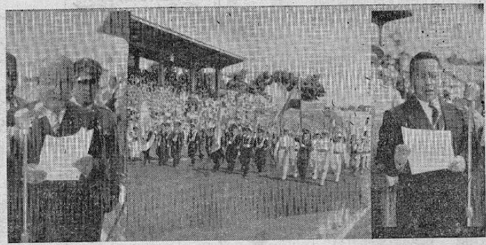
De izquierda a derecha: El Embajador de Nicaragua pronuncia su elocuente discurso momentos antes de entregar a la Escuela Militar Salvadoreña la bandera de su patria — Cadetes Abanderados de Honduras, El Salvador y Nicaragua, con sus respectivos pelotones, desfilan por el Estadio, llevando enhiestas sus insignias nacionales — El Embajador, de Honduras pronuncia un brillante discurso en el momento de hacer entrega del pabellón de su país. — Los cadetes hondureños, que marchan a la izquierda, lucen uniforme azul, lo mismo que los salvadoreños. Los cadetes de Nicaragua, a la derecha, visten uniforme blanco con franjas rojas. Todos de rigurosa gala.