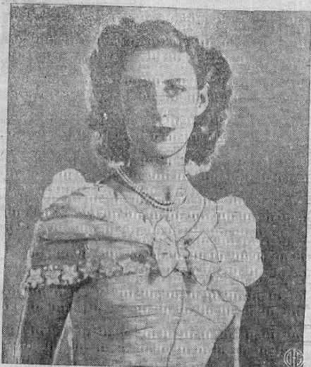
YA ES UNA MUCHACHA GRANDE — La princesa Margarita Rosa, que cumplió 18 años de edad el 21 de agosto, representó a sus padres, el Rey Jorge VI y la Reina Isabel en la investidura de la Princesa Juliana como Reina de Holanda en la ciudad de Amsterdam el 8 de septiembre. Esta fué la primera visita de la princesa inglesa a un país extranjero.