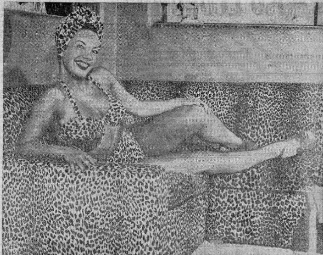
TODO CON PIEL DE LEOPARDO — Carmen Miranda, la artista brasileña, estaba tan encantada con su nuevo traje de baño hecho de piel de leopardo que mandó decorar su sofá con dicha piel. Sin embargo, no es difícil notar dónde comienzan las manchas de la piel de leopardo y dónde comienza la encantadora artista.